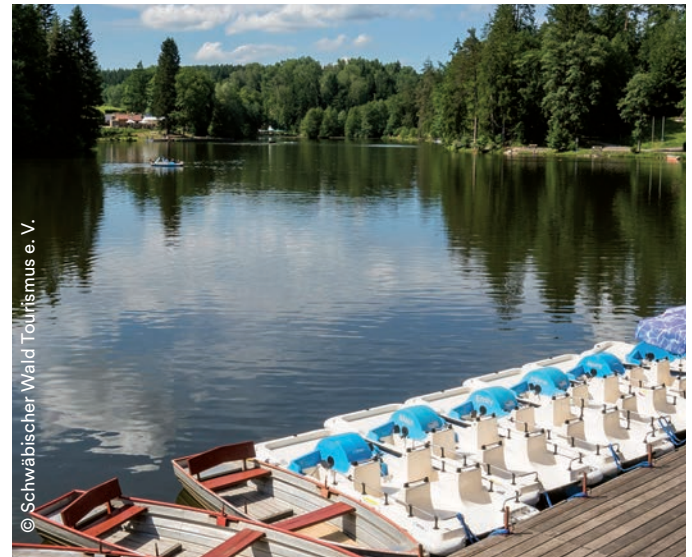
Ebensee, Perle im Schwäbischen Wald